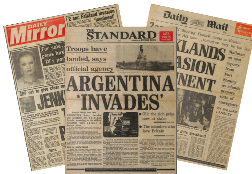
Portada de diarios británicos del 2 de abril de 1982

Fondo cartográfico: (en proceso) documentación sobre controversias limítrofes entre Argentina y Chile a largo de su historia y vasta frontera compartida