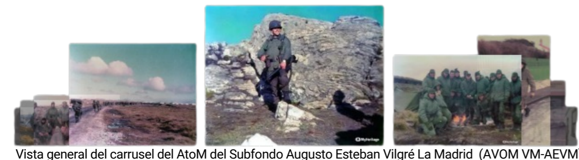
Vista general del carrusel del AToM del Subfondo Augusto Esteban Vilgré La Madrid (AVOM VM-AEVM)